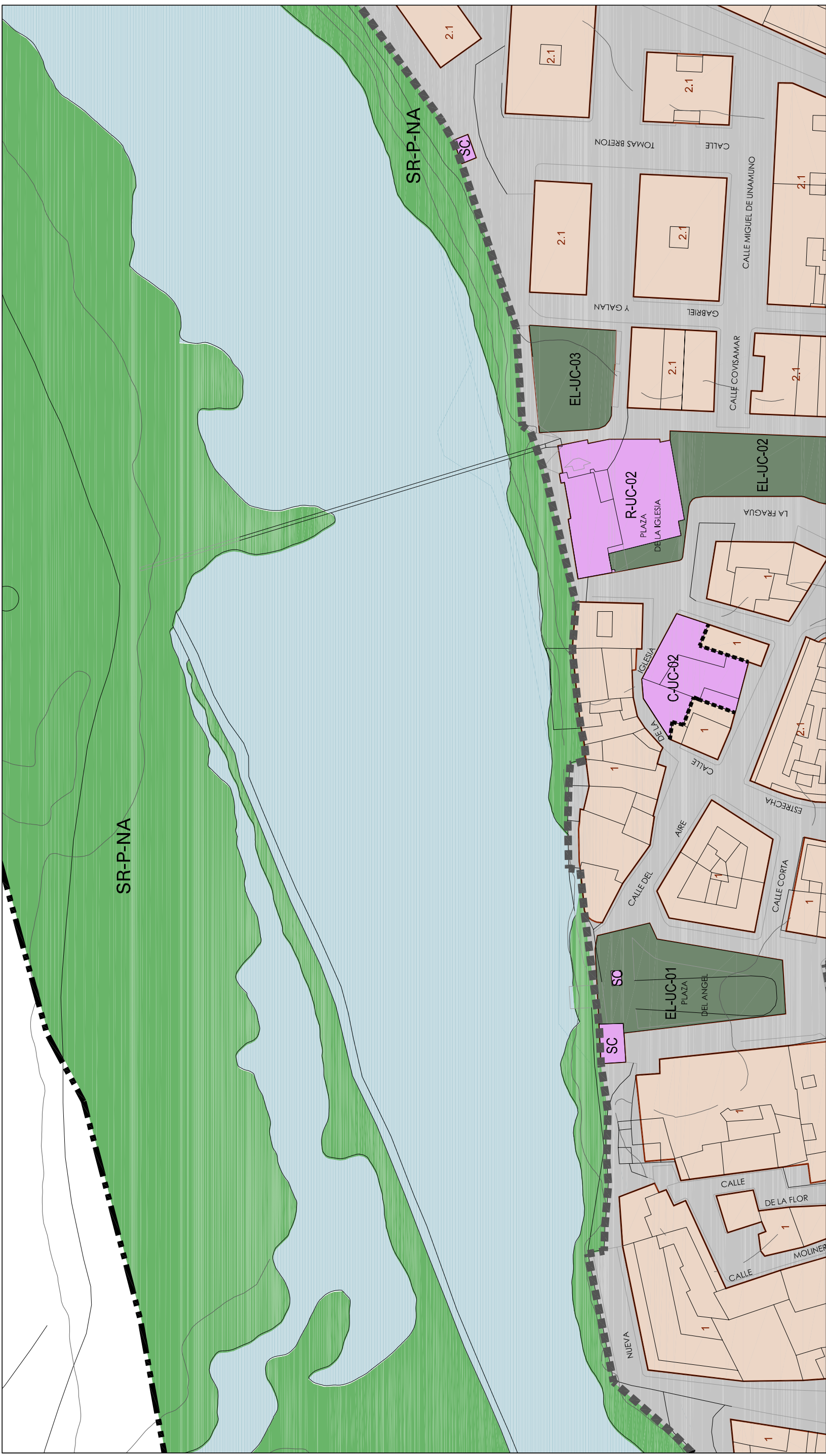
Localización en término municipal